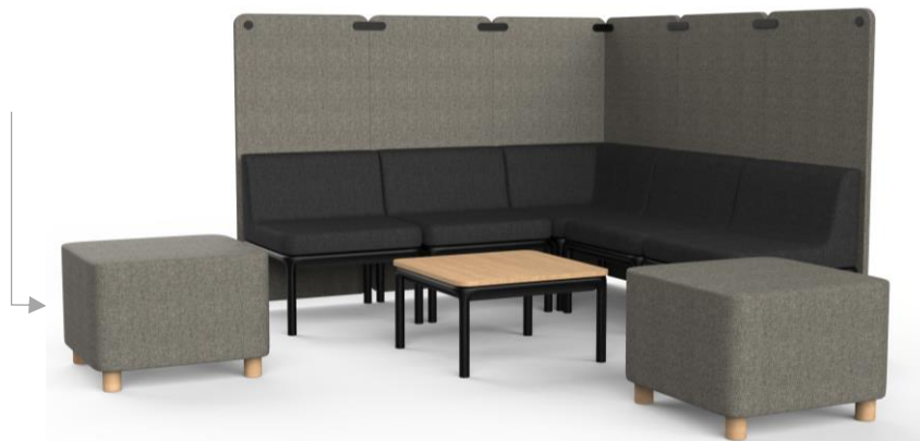
Pouf haut sur pieds bois

La gamme complète Lotua se compose de chauffeuses et poufs intégrant tables, tablettes, connectiques et cloisons.